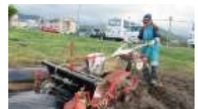
学校の畑のマルチ掛け