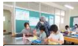
家庭科の裁縫の時間